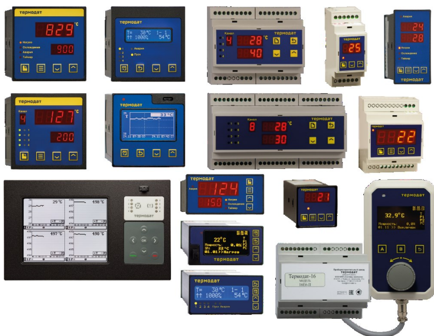
Рисунок 1 – Общий вид приборов

Пломбировка корпуса от несанкционированного доступа не предусмотрена.